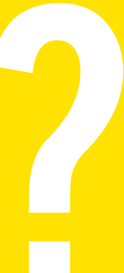
Tabla de contenido